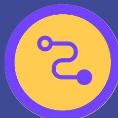
START-UP Įmonė, pirmi pardavimai