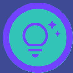
PRE-STARTUP Idėja, iki įmonės įsteigimo

Kuriame atvirą ir EdTech bendruomenę palaikančią ekosistemą. Kviečiame susipažinti su priemonėmis, kurių teikiama nauda galite pasinaudoti ir jūs, EdTech sprendimų kūrėjai. Apie kiekvieną priemonę daugiau sužinoti galite paspaudę ant priemonės pavadinimo. Gaukite tikslią informaciją kreipdamiesi žemiau nurodytais kontaktais. Išnaudokite galimybes ir įgyvendinkite savo EdTech idėją. Mes tikimės, kad ši informacija padės jums rasti tinkamą priemonę kurti, plėtoti ir (ar) finansuoti EdTech sprendimą ir pasiekti savo tikslus!